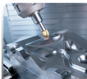
APPLICAZIONE A 5 ASSI SETTORE STAMPI