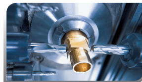
TORNITURA DA BARRA