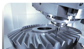
LAVORAZIONE RUOTE DENTATE